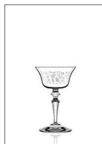
Presidente + decoro