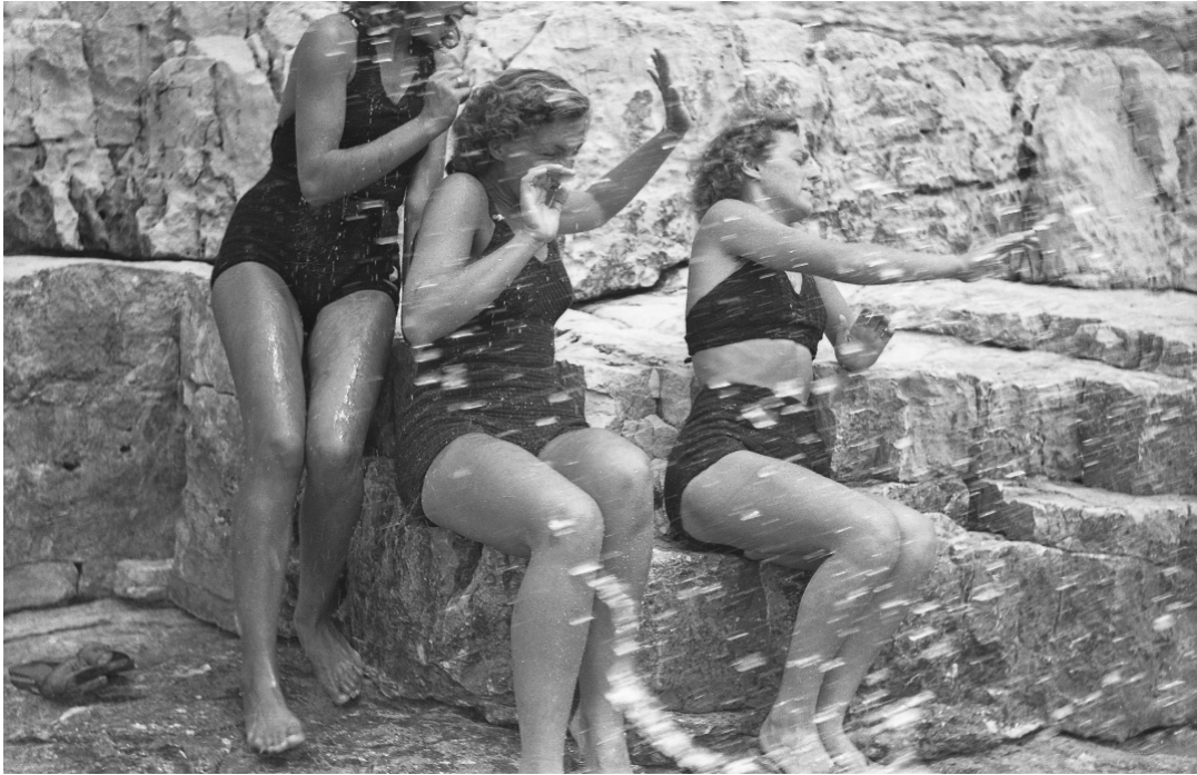
Lost and Found, fotografia anonima, 1940 ca.